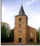
St. Martin Stotzheim