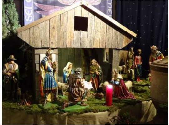
Krippe in Euenheim 2017/2018

Auch in diesem Jahr möchten wir an der Aktion „Offene Krippen“ festhal- ten, und so werden die Kirchen in Billig, Elsig, Euenheim, Frauen- berg, Kreuzweingarten, Stotzheim und Wißkirchen am Sonntag, dem 06. Januar 2019 von 15.00 bis 17.00 Uhr für Krippenbesuche geöff- net sein.