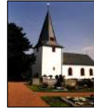
Hl. Kreuz Kreuzweingarten mit Billig und Rheder