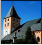
St. Georg Frauenberg