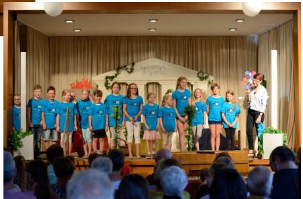
Neue Chor-T-Shirts, neuer Name: "HardtChor"