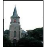
St. Briccius Euenheim