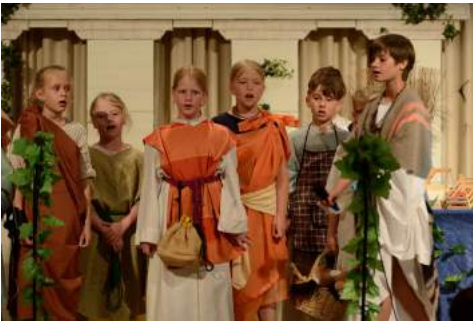
Händler, Käufer und der Bettler