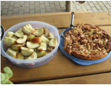
Das Buffet spricht für sich....