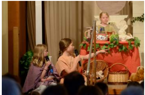
Kinder auf dem Markt