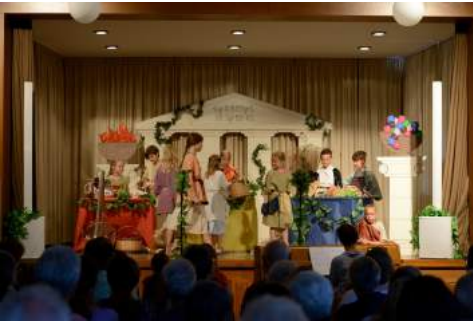
Markt auf dem Tempelvorhof